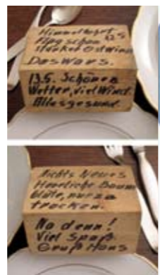
Anke Gröner Blog „Mein Opa war Blogger“