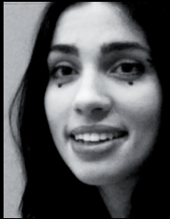
Nadja von Pussy Riot – 2017

Nadja, Why are you creative? (!) RIOT. Wahong