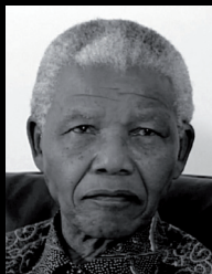
Nelson Mandela – 1999