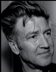
David Lynch – 1997