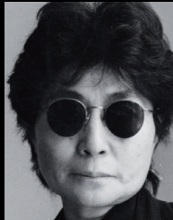
Yoko Ono – 1994