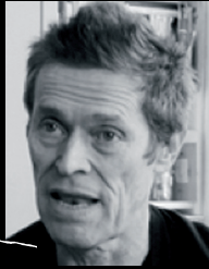
Willem Dafoe – 2014